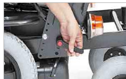
Facile smontaggio per trasporto in auto Easily disassembling for transport on car

Sedie elettroniche Electronic wheelchairs