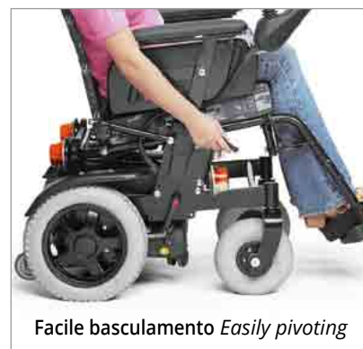
Facile basculamento Easily pivoting